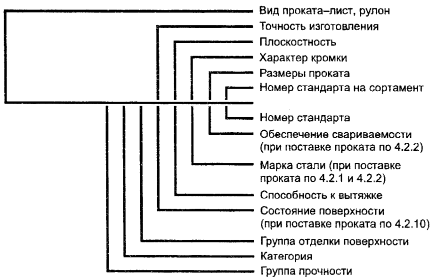
Схема условных обозначений проката

Примечание — При отсутствии указания какого-либо из параметров его выбирает предприятие-изготовитель.